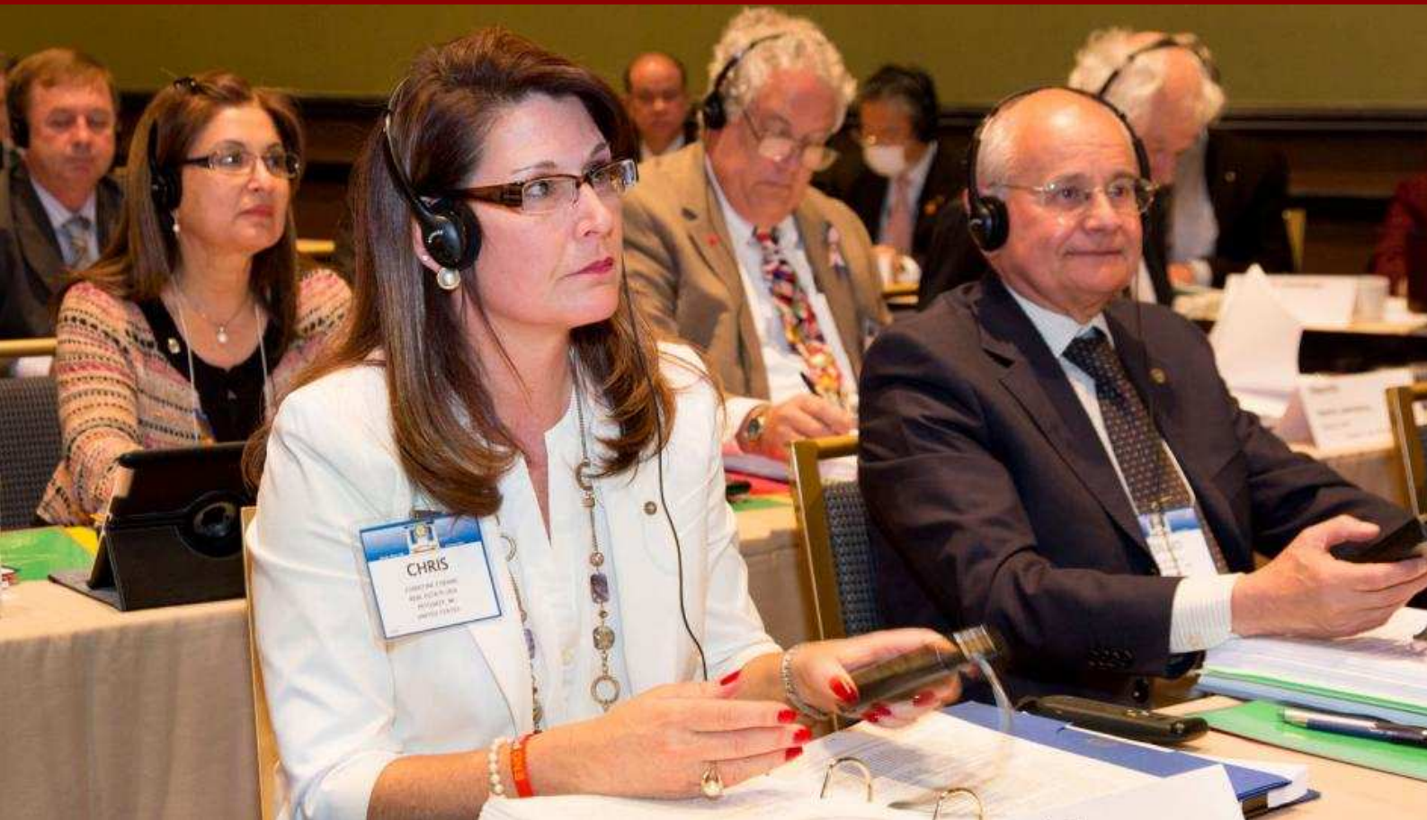
Delegados no decorrer do Conselho de Legislação de 2013 de RI

Os representantes dos 532 distritos de Rotary reuniram-se em Chicago de 21 a 26 de abril para votar medidas que visam o fortalecimento da organização, crescimento do quadro social e eficácia na prestação de serviços.